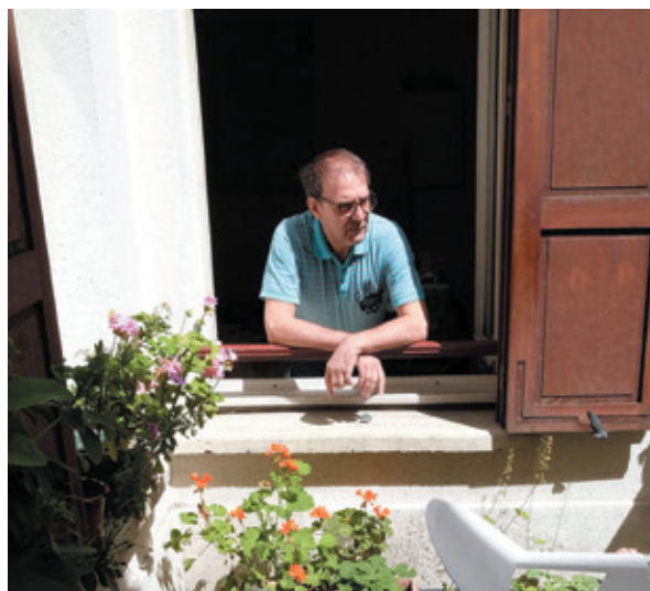
TÉMOIGNAGE D'UN RÉSIDENT

En 2017, l'ensemble de ces résidences représente 177 logements et 18 nouveaux locataires ont obtenu une place dans l'une de ces résidences.