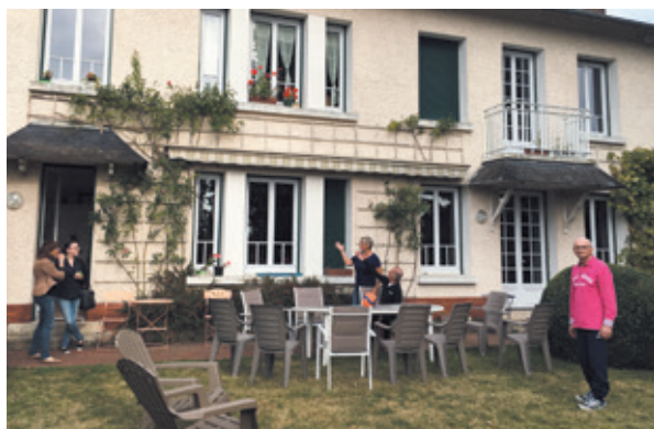
La colocation Alzheimer des petits frères des Pauvres à Beauvais

« J'ai rejoint l'équipe des bénévoles de la Fondation en janvier 2017. En tant que parisien, j'ai toujours entendu parler des petits frères des Pauvres. J'ai contacté la Fondation par son site internet, pour faire des petites réparations chez les locataires. Aujourd'hui, je participe aussi au comité qui étudie toutes les demandes de financement faites directement à la Fondation. Ce comité réunit des compétences très variées et a la responsabilité d'étudier en détail les dossiers avant leur présentation aux administrateurs. Je suis toujours frappé par la complémentarité des regards sur les projets, le professionnalisme des équipes et la pertinence des questions posées en séance. Une fois la décision finale prise, ce sont de véritables partenariats fiables et pérennes qui voient le jour. »