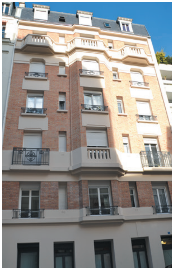
La Résidence La Chine

« Suite à un licenciement, je ne pouvais plus payer mon loyer. J'ai dû dormir dans la rue 8 mois. Grâce à Emmaüs, j'ai eu un hôtel social pendant 2 ans. Puis je suis tombé malade et j'ai rencontré les petits frères des Pauvres. Quand ma référente m'a annoncé que j'allais à la pension de famille Rue de la Chine, ça m'a enlevé un grand poids. En 2017, grâce aux petits frères des Pauvres, j'ai obtenu un logement pérenne auprès de la ville de Paris mais je continue d'aller régulièrement à la résidence prendre des nouvelles. »