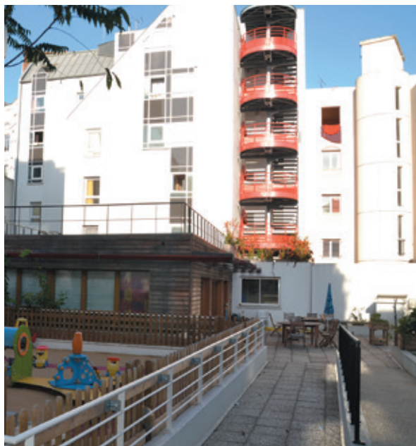
La Résidence Gautier Wendelen

Un projet de relocalisation de ce centre est en cours.