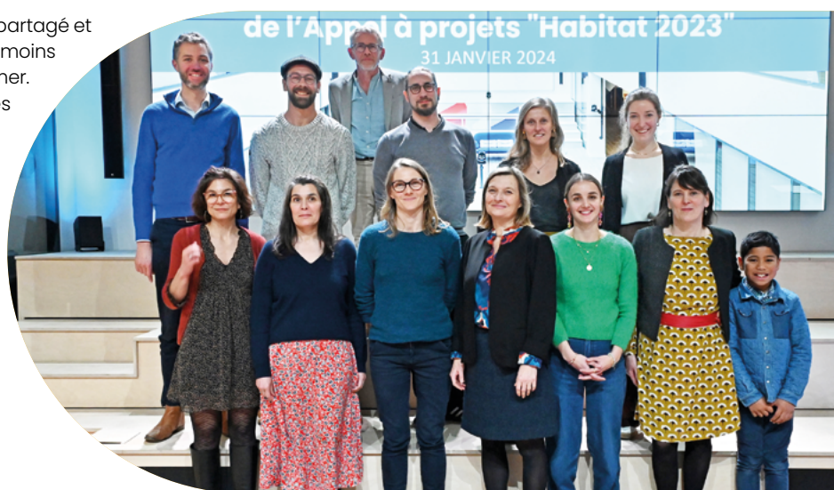
Lauréats de l'appel à projets Habitat 2023

Basée dans l'Orne, l'Association Vertoit rénove et aménage une ancienne maison de ferme pour mettre en œuvre un projet d'habitat partagé, comprenant des espaces communs intérieurs et extérieurs. Trois studios, adaptés aux personnes à mobilité réduite, loués à des loyers modérés seront créés. Soucieuse de l'environnement, l'Association privilégie l'utilisation de matériaux écoresponsables et le savoir-faire traditionnel et a pour objectif de participer à la réimplantation d'une vie intergénérationnelle dans nos campagnes.