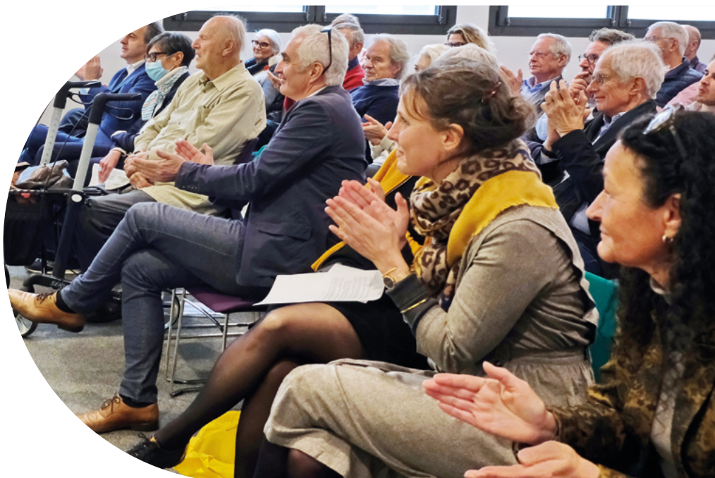
Séminaire de fin d'année