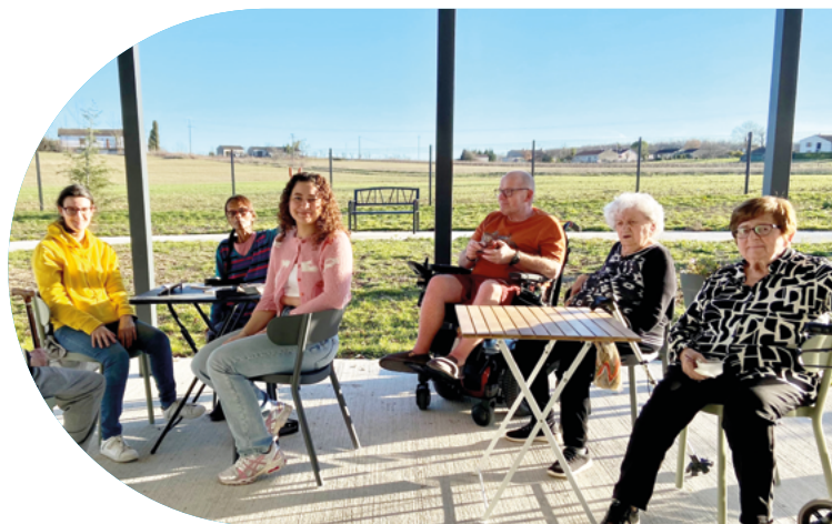
Maison Astrolabe

Inspirée de l'architecture de la Maison de Gardanne à Marseille et de son esprit de soins palliatifs, la Maison Astrolabe est avant tout un lieu de vie chaleureux et de répit pour des personnes en perte d'autonomie. Située à Cahuzac-sur-Vère (81), cette maison a reçu le soutien de la Fondation Andrée Morillon pour son fonctionnement et des frais d'investissement visant un meilleur confort de ses résidents.