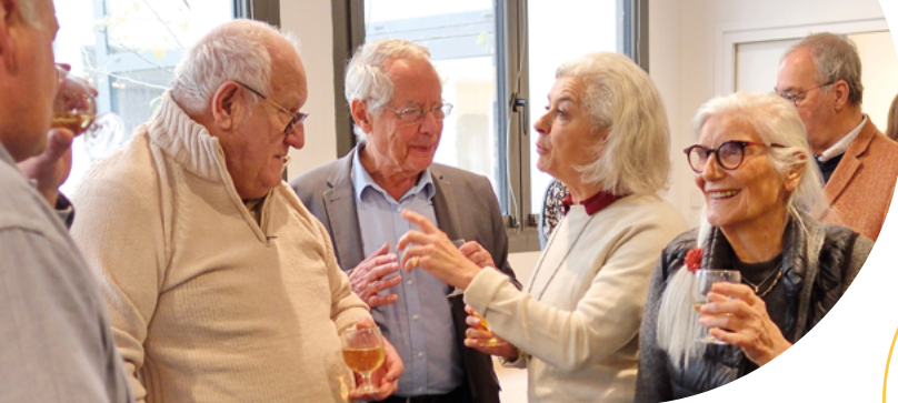
Séminaire de fin d'année - © Daniel Schwab