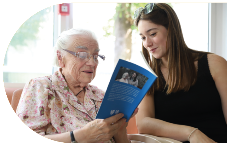
Chaque Histoire Compte Vraiment - ©CHCV

L'« Opérabus » créé par l'ensemble baroque Harmonia Sacra de Valenciennes apporte une réponse concrète aux problématiques de démocratisation culturelle et d'inclusion sociale par la culture. Pour favoriser le lien social et intergénérationnel, l'Opérabus donnera 72 représentations lors d'une tournée de 18 jours à la rencontre des résidents des EHPAD et foyers de la région Hauts-de-France. Un projet ouvert aux familles, aux personnels soignants ainsi qu'aux habitants.