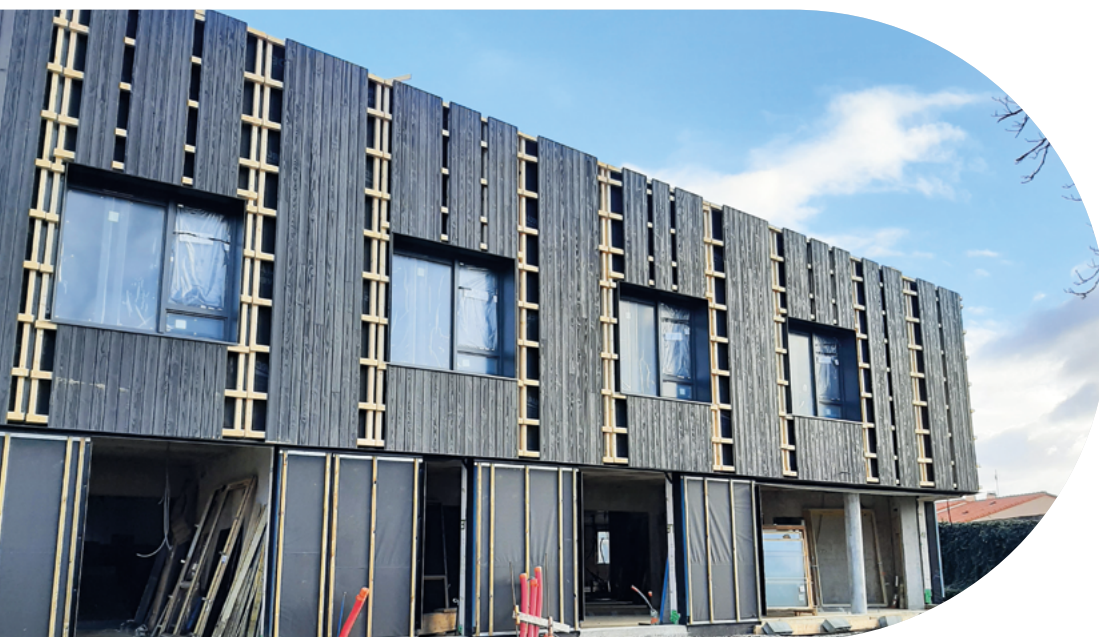
Pension de famille à Vertou

Cf. Site des Bricos du cœur Chantier Solidaire : logement à Lille rue de Marseille.