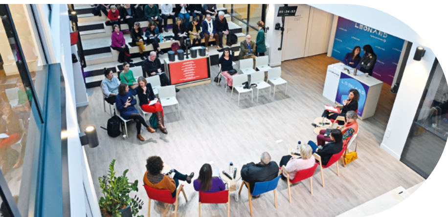
Cérémonie remise des prix appel à projets Habitat 2023 chez Léonard, Paris