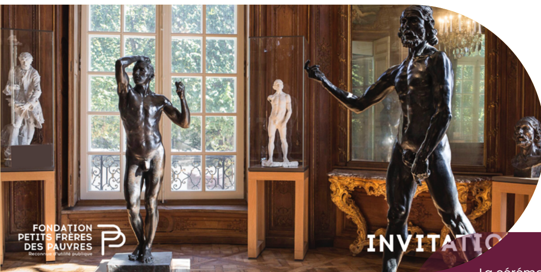
Carton d'invitation cérémonie remise de prix, juillet 2023

La cérémonie de présentation des lauréats et de remise des prix s'est déroulée au musée Rodin le jeudi 6 juillet 2023.