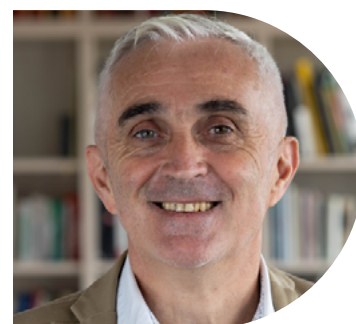
Par Gaël Brenaut, Président