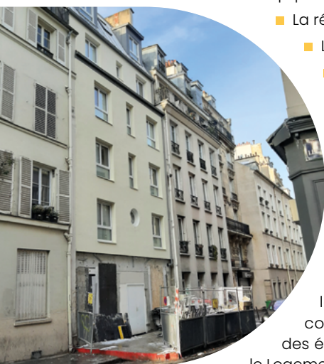
Exemple de chantier en cours

Les locataires de ces logements sont suivis par l'équipe de gestion locative de la Fondation ainsi que par différents types de partenariats et d'associations, comme Champ-Marie, Entre2Toits ou Un Toit Pour Tous, l'Association de gestion des établissements des Petits Frères des Pauvres (PFP-AGE) et les équipes « Action Vers le Logement » (AVL) de l'Association des Petits Frères des Pauvres.