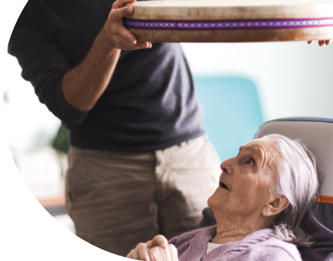
Fondation Artistes à l'Hôpital