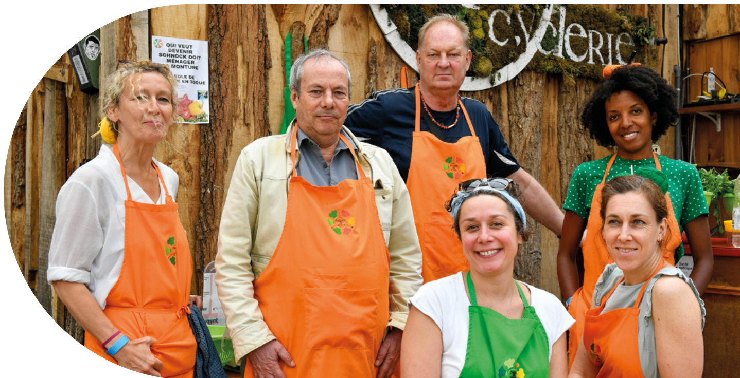
Toques en stock

Située à proximité de Rennes, cette association œuvre pour le mieux-être des personnes en collectant des produits d'hygiène qu'elle redistribue ensuite aux personnes ayant de faibles ressources, en particulier aux personnes âgées en situation de précarité. La Fondation accompagne Bulles Solidaires dans différents aspects de cette action, tels que l'achat de fournitures et l'aménagement du local de collecte, etc.