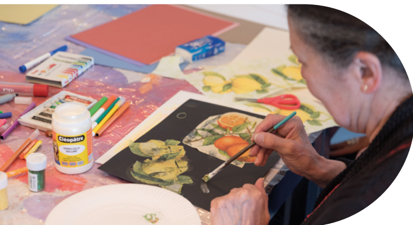
Fondation UTB - ©H Elbaum

Les fondations abritées ont soutenu 55 actions pour un montant total de 955 217 €, dont 42 % en faveur des Petits Frères des Pauvres et 58 % en faveur d'autres associations.