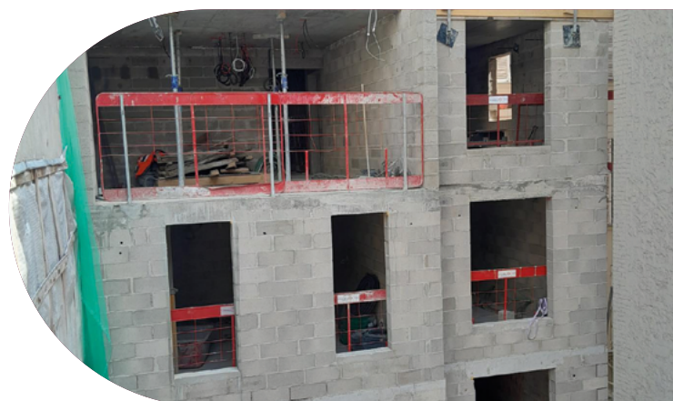
Pension de famille, Rivages (Paris 17)

Ce projet parisien ouvrira ses portes en avril 2024. Cette pension de famille est soutenue par l'État, la ville de Paris et la région Ile-de-France est possible grâce au soutien des donateurs de la Fondation.