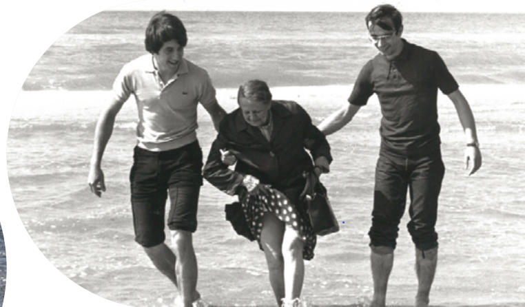
Séjour vacances Petits Frères des Pauvres en 1970