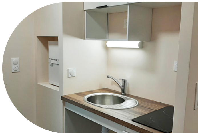
Exemple de logement

Au cours de l'exercice 2023, 45 attributions ont été réalisées, contre 25 en 2022, grâce à la mise en service de 19 nouveaux logements (16 au sein de la petite unité de vie Gautier-Wendelen située dans le 19 e arrondissement de Paris et 3 au sein de la Maison de Charmanon à Grézieu-la-Varenne) lors de 7 commissions logement.