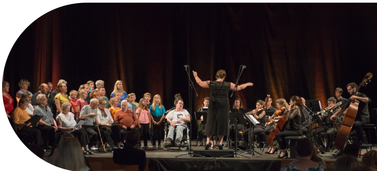
Les Concerts de Poche - ©Didier Bonnel