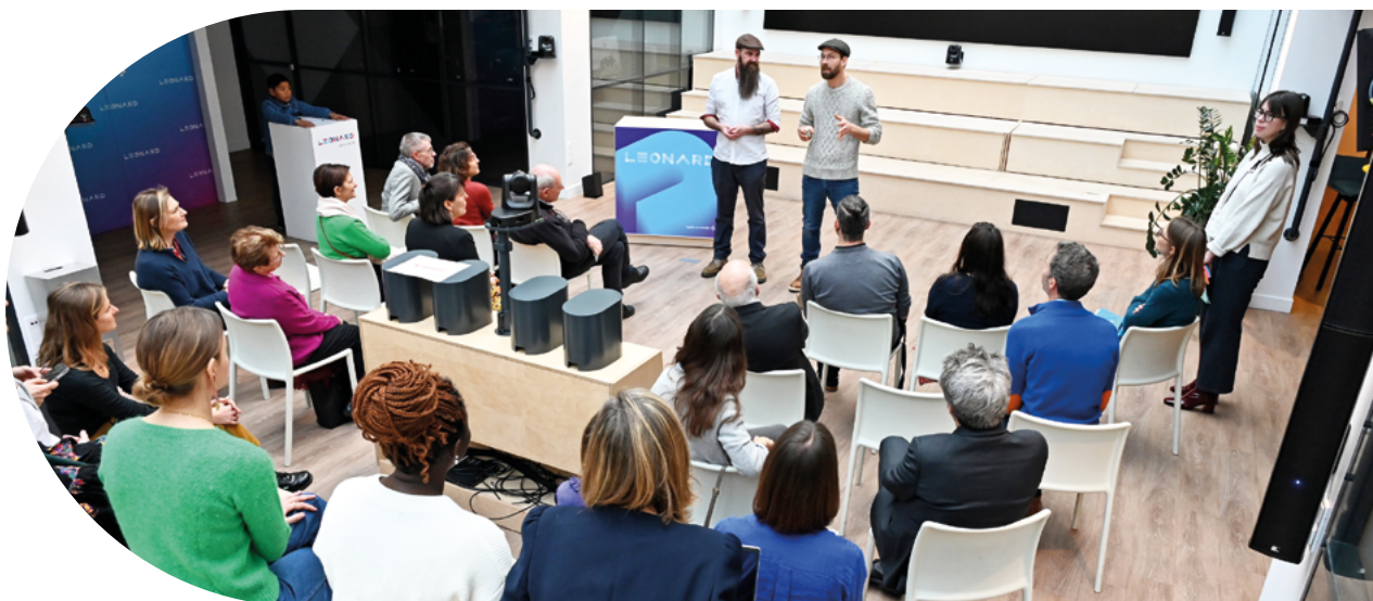
Cérémonie remise des prix appel à projets Habitat 2023 chez Léonard : Paris

L'association Loki Ora a pour objectif d'accompagner des colocations durables et sereines en favorisant le libre choix et la responsabilité des personnes. Ces colocations s'adressent à des seniors qui souhaitent vivre ensemble et en toute autonomie. 4 colocations de 4 personnes chacune ont déjà vu le jour sur la région nantaise.