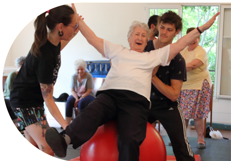
Académie Fratellini - @Justine Caron

Pendant une durée de trois ans, l'Académie Fratellini va renforcer son engagement envers les seniors en EHPAD ou résidences autonomie en leur faisant découvrir le cirque contemporain et les artistes en devenir. Des moments réguliers d'échanges et d'activités - des ateliers de cirque, des rencontres et des spectacles - seront organisés pour encourager l'autonomie, la confiance en soi, l'ouverture artistique et le bien-être des participants pour rompre leur routine et l'isolement.