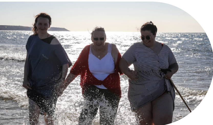
Séjour Maris Stella à Wissant, août 2022 - Equipe Lille Fives

L'Association Petits Frères des Pauvres recommande la création d'espaces conviviaux, l'ouverture de lieux collectifs aux aînés et la promotion d'habitats intergénérationnels, tout en plaidant contre la marchandisation du lien social et en appelant à une sensibilisation accrue contre l'âgisme. Ce rapport constitue un appel à l'action pour réduire l'isolement des aînés par le renforcement des liens intergénérationnels, offrant un éclairage précieux sur les défis et les solutions potentielles pour une société plus inclusive.